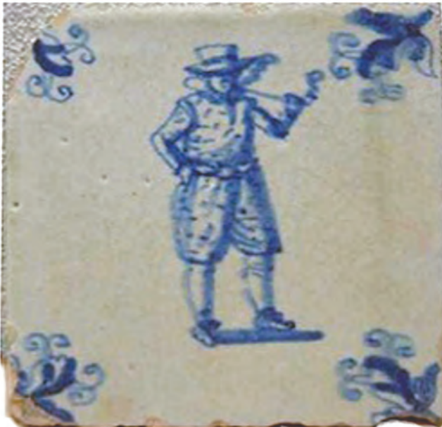
Afb.47. Tegel met vroege spinnekop hoekversiering, 3e kwart 17e eeuw

In het eerste kwart van de 17e eeuw werden er ook nog andere tegels gemaakt waarbij de hoekvullingen waren uitgevoerd in een spaartechniek. Deze ontwerpen werden ontleend aan het Chinees porselein. De afbeeldingen 2 t/m 10 hebben als decor staande en zittende pijprokers met hoekelementen in de zogenaamde Wan-Li stijl.