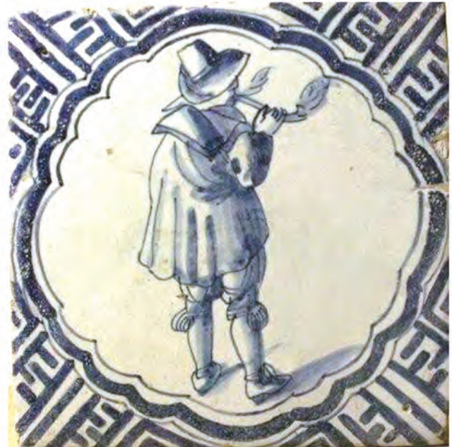
Afb.2. Tegel met Wan-li hoekmotief, 1e kwart 17e eeuw

de 'Iberische mode' maakte de Hollanders nu ook kennis met de veelkleurige Italiaanse majolica. Gedurende vele jaren zouden er grote partijen majolica borden, schotels, kommen en wat dies meer zij uit allerlei Italiaanse productiecentra worden geïmporteerd. Om godsdienstige en economische redenen besloten een aantal Italiaanse majolicabakkers hun bedrijven te verlaten en in de Nederlanden voor zich zelf te beginnen. Voor 1600 waren er in Antwerpen, Haarlem, Delft, Amsterdam, Dordrecht en Harlingen reeds Italiaanse en Hollandse majolicabakkerijen actief. 2 De meeste van deze majolicabakkers begonnen ook veelkleurige decoratieve majolica wandtegels te produceren.