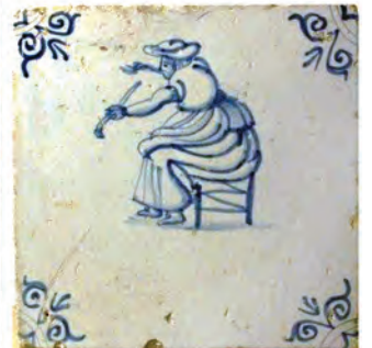
Afb.31-38 (van linksboven naar rechtsonder). Tegels met Ossekop hoekmotief, midden 17e eeuw