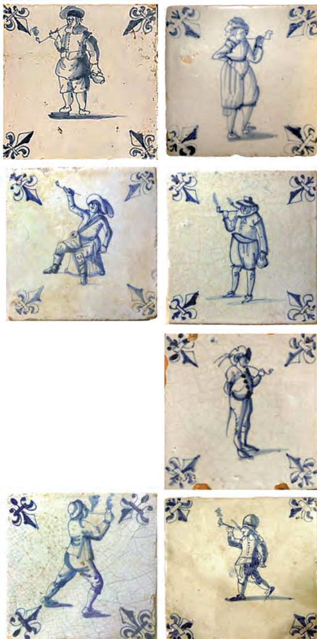
Afb.15-21 (van linksboven naar rechtsonder). Tegels met Fleur-de-Lis hoekmotief, vanaf 1e kwart 17e eeuw

peratuur van circa 1000 °C. Vaak waren de ovens een gemeenschappelijk bezit van de 'roodbakkers' (de pottenbakkers die het gewone gebruiksgoed van roodbakkend aardewerk maakten), de plateelbakkers, de tegelbakkers en de pijpenmakers.