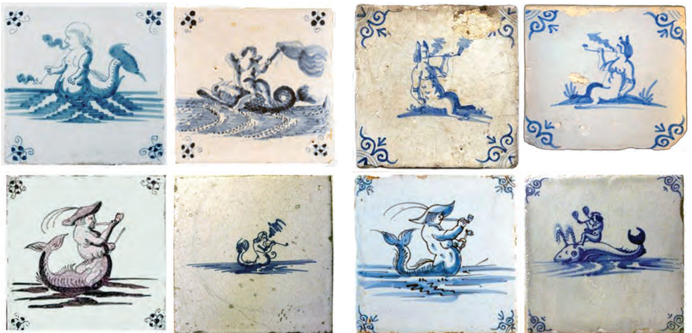
Afb. 57-64 (van linksboven naar rechtsonder). Tegels met Ossekop hoekmotief, midden tot eind 17e eeuw