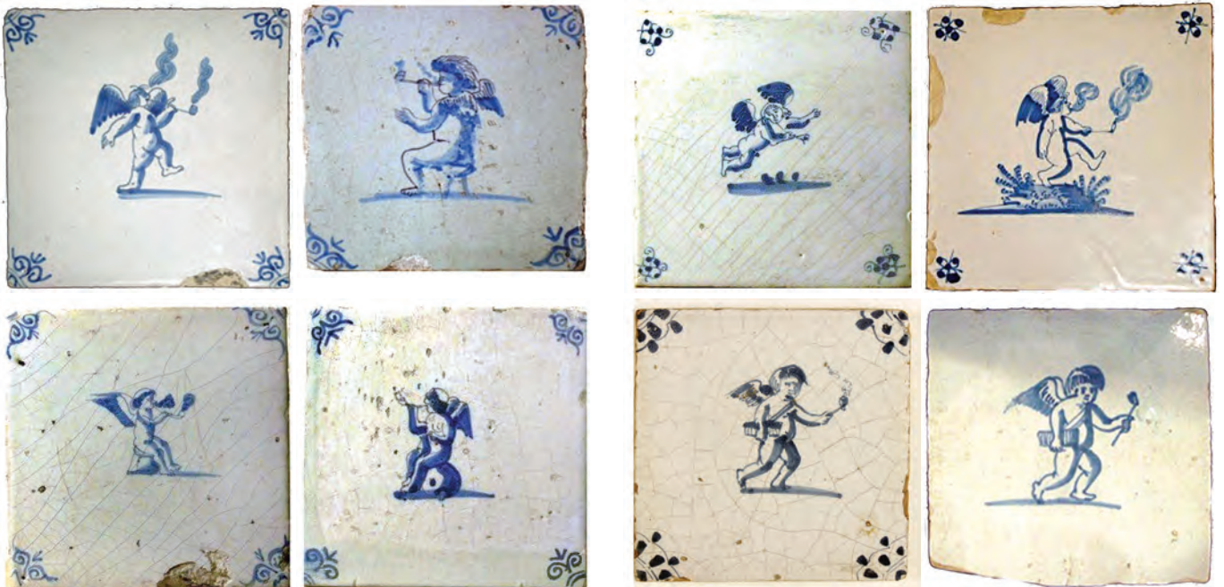
Afb. 66-73 (van linksboven naar rechtsonder). Tegels met afbeeldingen van rokende Putti hoekmotief, midden tot eind 17e eeuw