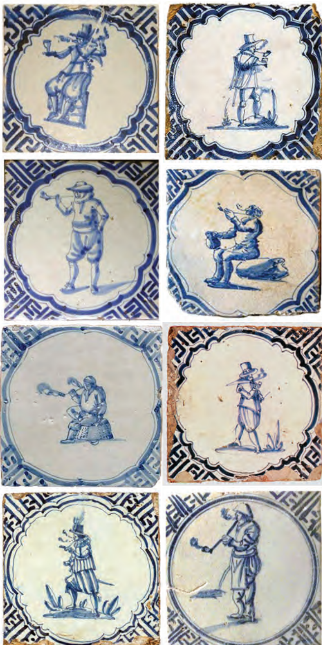
Afb.3/10 (van linksboven naar rechtsonder). Tegel met Wan-li hoekmotief, 1e kwart 17e eeuw

Na de kennismaking met porselein uit China in Europa, in het eerste decennium van de 17e eeuw, begon er nogal wat te veranderen in de Hollandse interieurs. Omdat het geïmporteerde porselein zeer gewild was maar bijzonder kostbaar, werd met grote energie geprobeerd om dit fraaie en zeer dun uitgevoerde serviesgoed te imiteren. Helaas lukte dit met de beproefde majolicatechniek, waarbij borden – gescheiden door proenen - gestapeld de ovens in gingen, niet. Omdat de Hollanders het Chinese geheim (het gebruik van speciale kaoline aarde) niet kenden, kon men eeuwen lang de kwaliteit van het Chinese porselein niet evenaren. Ook in Italië raakte men bekend met het Chinese porselein en ook zij begonnen te experimenteren. Uiteindelijk lukte het de Italianen om met behulp van kokers met pennen borden en schotels te maken die veel dunner waren dan via de majolicatechniek. Het nieuwe product werd "faience" of "fayence" genoemd naar de Italiaanse stad Faenza waar het werd vervaardigd.