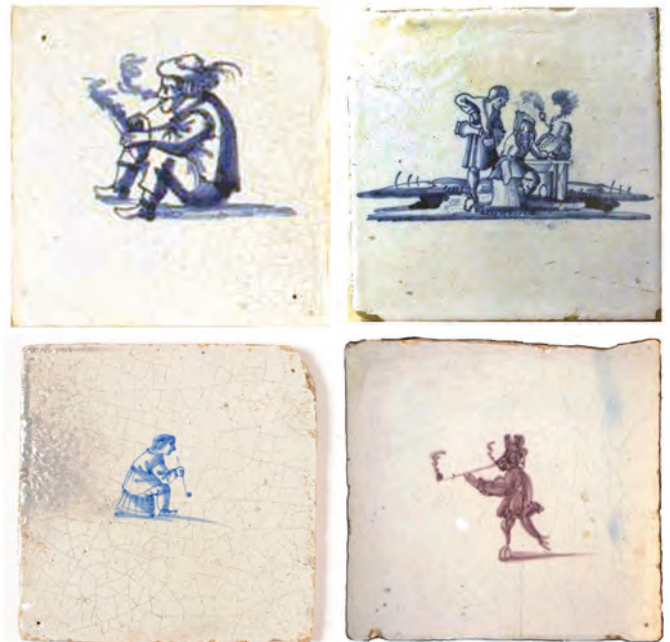
Afb. 84-87. (van linksboven naar rechtsonder). Tegels zonder hoekversiering, 18e eeuw.

In de loop van de 18e eeuw werd het mode om de hoekversieringen geheel weg te laten (afb. 84 t/m 88). Het effect was dat een met deze tegels betegelde muur minder dominant was in het interieur. Pijprokers op tegels komen nu steeds minder voor. Wel werd het assortiment van decors uitgebreid met stillevens van rook- en drinkgerei, bestaande uit tabaksdozen, rooktestjes, kleipijpen en wijnglazen (afb. 88 t/m 91).