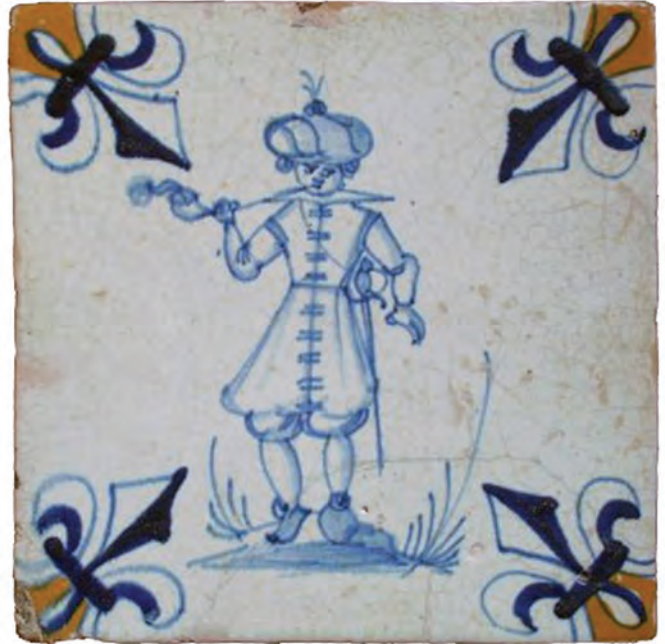
Afb.14., Tegel met polychrome Fleur-de-Lis hoekversiering, vanaf 1e kwart 17e eeuw

Bij de productie van wandtegels was (net zoals bij de fabricage van ceramiek en kleipijpen) de samenstelling en de kwaliteit van de klei uitermate belangrijk. Het mengen van de geïmporteerde klei, dikwijls afkomstig uit verschillende kleiputten, het zuiveren van (organische) verontreinigingen, het rotten in kleibakken en het walsen tot langwerpige kleiplaten behoorden tot de geheimen van de tegelbakkers. Vervolgens werden de tegels met behulp van een houten mal uitgesneden. Na het drogen werden deze kleitegels in een oven gebakken bij een tem-