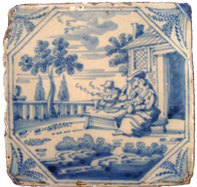
Afb. 82. Landschapstegels, 18e eeuw.

Ook hier zien we weer goed geklede burgers die het rookgenot afwisselden met een goed glas (afb. 23 t/m 29). De enige persoon die duidelijk aan het werk is zien we op afb. 30. Het is een pijpenverkoper, dus we moeten hier spreken over een "ambachtstegel".