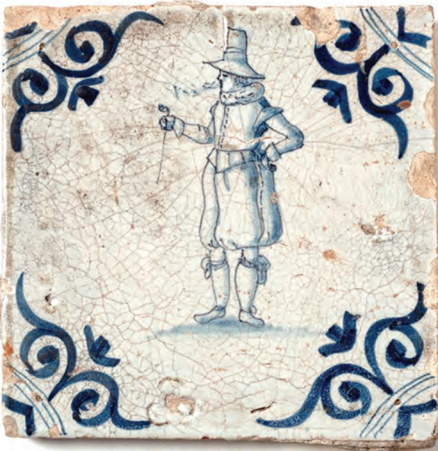
Afb.22. Tegel met ossekop hoekversiering, ca. 1630-1640

Als de spons werd omgedraaid ontstond er een afbeelding in spiegelbeeld wat weer een toevoeging was aan het bestaande assortiment. In de 18e eeuw werden er ook dunne koperen plaatjes als sponzen gebruikt.