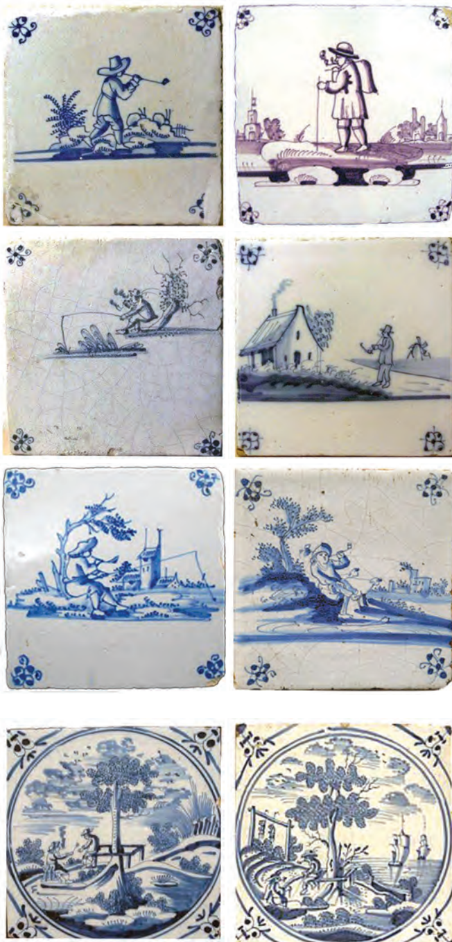
Afb. 74-81. (van linksboven naar rechtsonder). Landschapstegels, 18e eeuw.

In het midden van de 17e eeuw kende de rijkdom in de Nederlanden geen grenzen. Dit is duidelijk te zien aan de op de tegels (met ossenkop hoekversieringen) afgebeelde burgers en militairen (afb. 31 t/m 46). Ook bij de schutterij werd er smakelijk een pijpje gerookt (afb. 32). Omdat het roken en drinken vaak samenging, was 'hoge nood' natuurlijk aan de orde van de dag. Ook het 'wildplassen' zien we terug op sommige tegels (afb. 37).