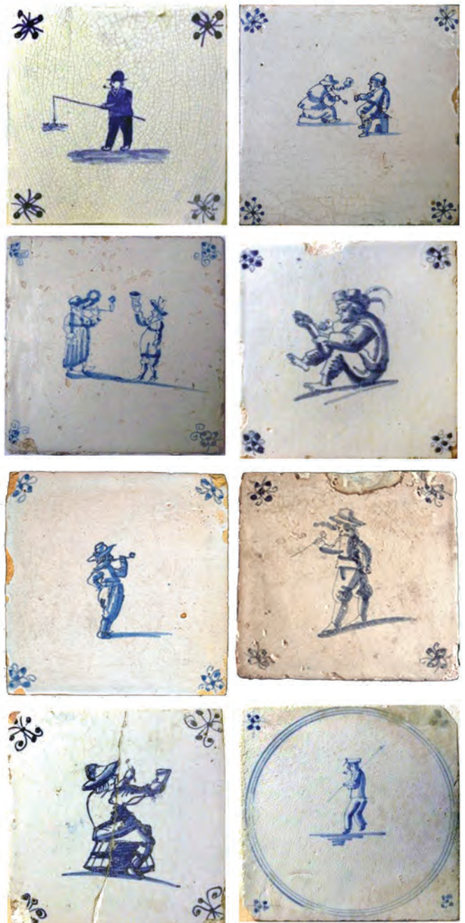
Afb.48-55 (van linksboven naar rechtsonder). Tegels met Spinnekop hoekmotief, vanaf 3e kwart 17e eeuw

Vanaf het eerste kwart van de 17e eeuw verschijnen er ook tegels die fleur-de-lissen (Franse of Bourgondische lelies), gelijk speerpunten, als hoekelementen hebben (afb. 14 t/m 22). De lelies op de tegel op afbeelding 14 zijn met een oranje kleur verfraaid. Het bijzondere hoofddeksel en de kleding van de met een sabel uitgeruste persoon vertoont enige gelijkens met de figuur op de vroeg 17e-eeuwse polychrome tegel op afbeelding 1. Het is interessant om te zien dat er nu, gezien de kleding, ook 'gewone' burgers werden afgebeeld op tegels (afb. 20 en 12).