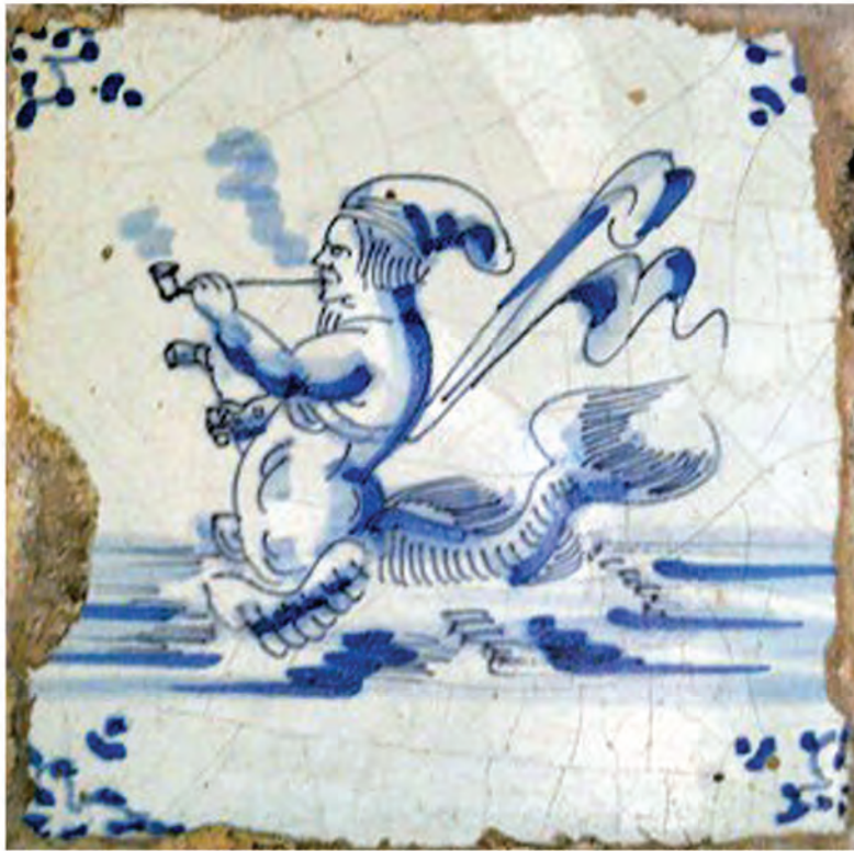
Afb.56. Tegel met afbeelding van pijprokend zeemonster, midden 17e eeuw.