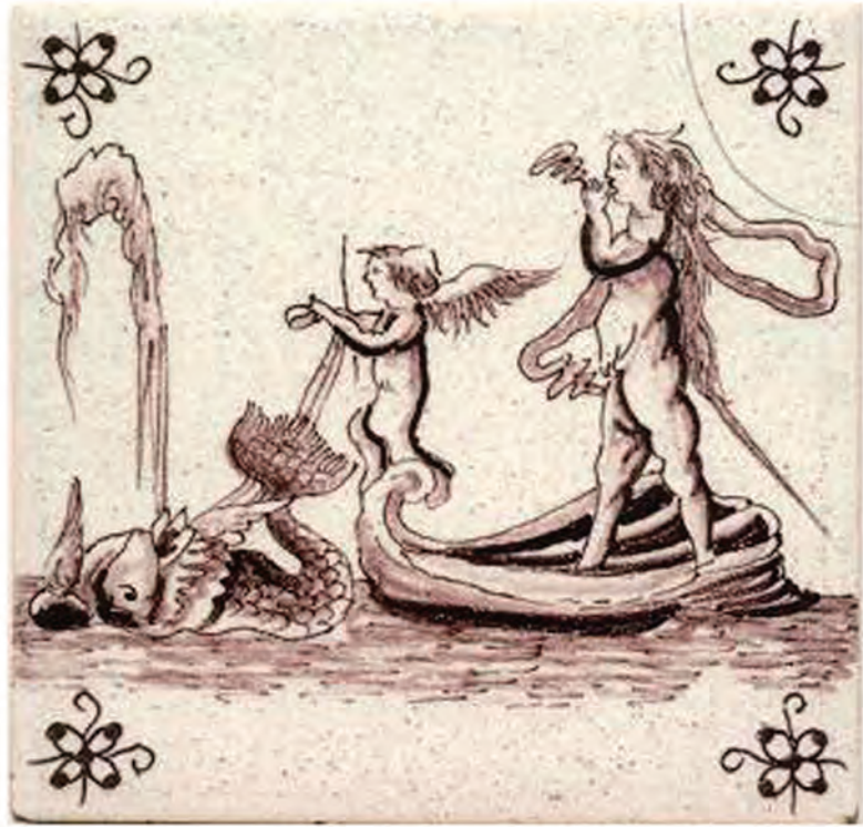
Afb.65. Mangan kleurige tegel met afbeelding van zeemonster en pijprokende putti, laatste kwart 17e eeuw.