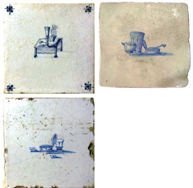
Afb. 88-91. (van linksboven naar rechtsonder). Tegels met stillevens, 18e eeuw.