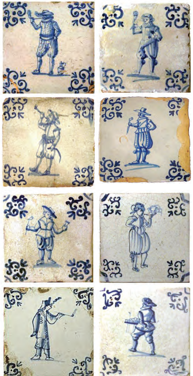
Afb.23-30 (van linksboven naar rechtsonder). Tegels met dubbele ossekop hoekmotief, vanaf 2e kwart 17e eeuw

Een van de oudst bekende polychroom beschilderde majolica wandtegels met een afbeelding van een pijproker dateert uit de periode 1600-1615. De kleding van de zittende pijprokende man is nogal exotisch, althans afwijkend dan in die tijd in de Nederlanden werd gedragen (afb. 1). De hoeken van deze kwadraattegel zijn nog uitgevoerd in een spaartech-niek. Bij een blok van minstens vier van deze tegels vormen deze hoekelementen ook weer een figuur. Oorspronkelijk maakte deze zeldzame wandtegel deel uit van de Niemeyer Collectie te Groningen. 4