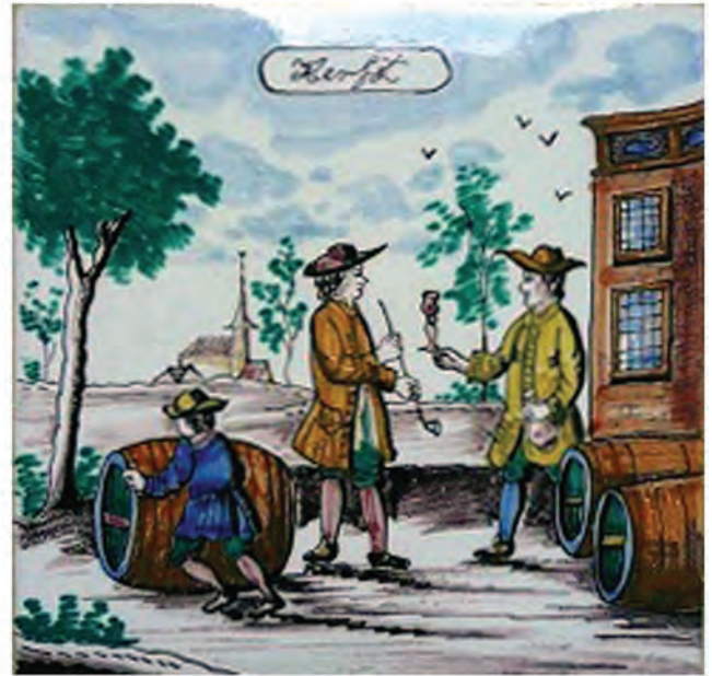
Afb. 92-98. (van linksboven naar rechtsonder en hierboven). Moderne tegels naar oud model.