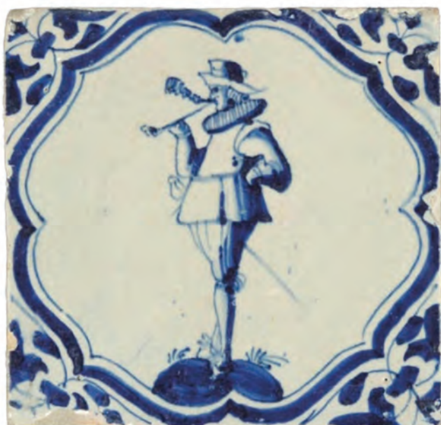
Afb.12, . Medaillontegel met afbeelding van man met sabel, 1625-1630

Het spreekt vanzelf dat de uitvoering van de Hollandse polychrome wandtegels ook de trend van de faïence producten ging volgen. De bontkleurige designs raakten uit de mode en werden vervangen door een tegel met een blauwe beschildering op een helder witte achtergrond. Als decor werd er een afbeelding op geschilderd van bijvoorbeeld een of meerdere personen (met name soldaten, ruiters en ambachtslieden), kinderspelen (waaronder zelfs bellenblazende kinderen), bloemen, landschapjes, dieren, zeewezens, fabeldieren, schepen en Bijbelse taferelen.