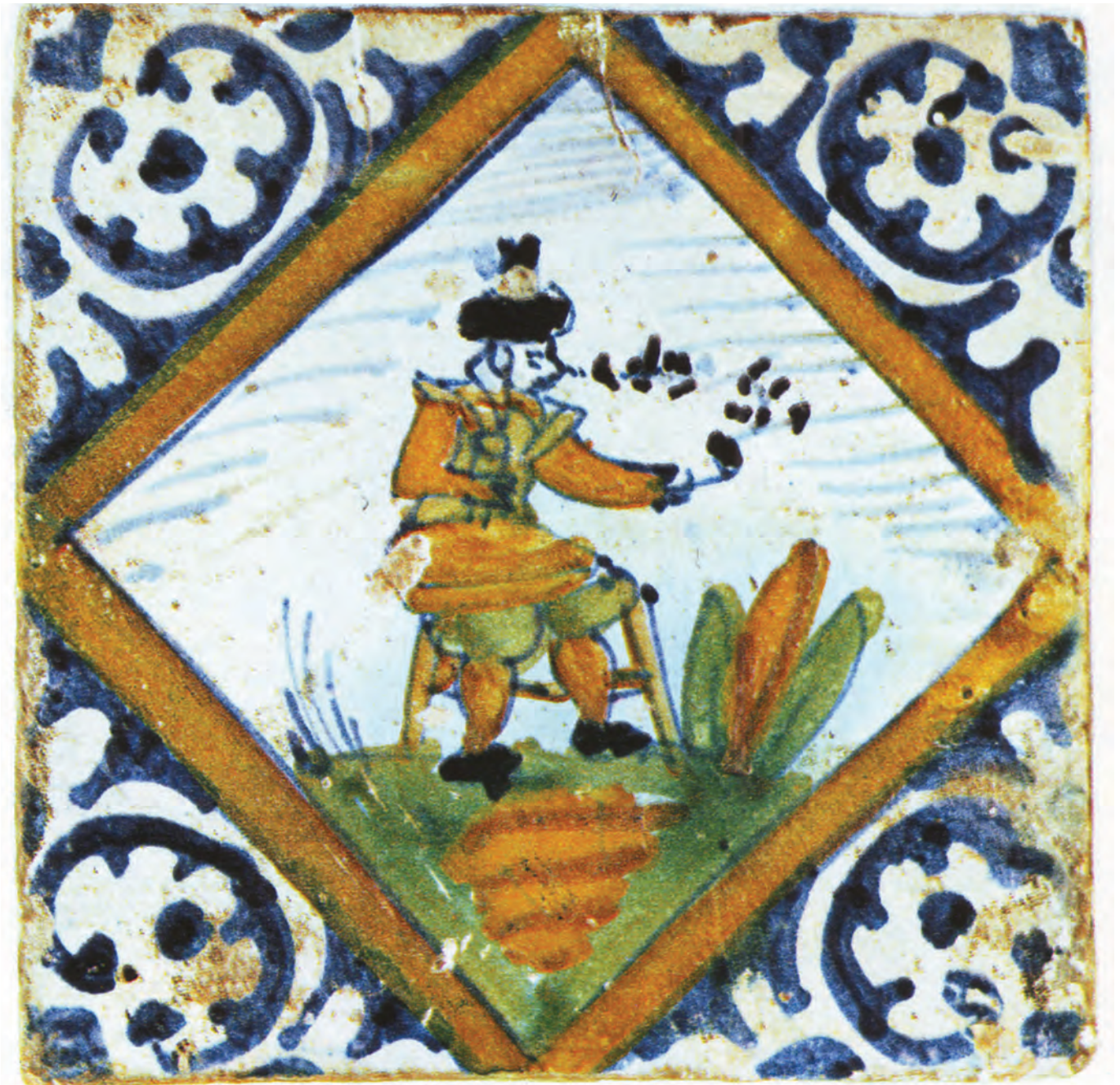
Afb. 1. Polychrome majolica tegel, ca. 1620.

Ongeveer in dezelfde tijd namen ook de contacten tussen de Nederlanden en Italië sterk toe. Naast