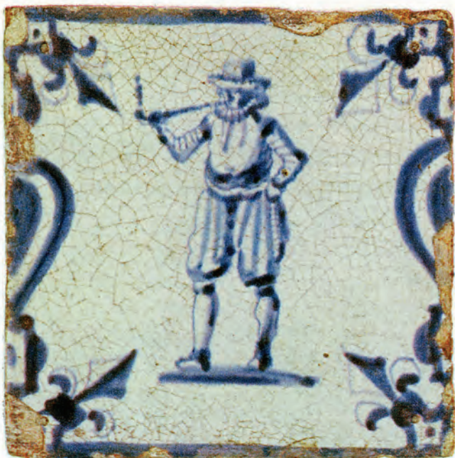
Afb.11 . Tegel met Baluster randversiering, 1e kwart 17e eeuw